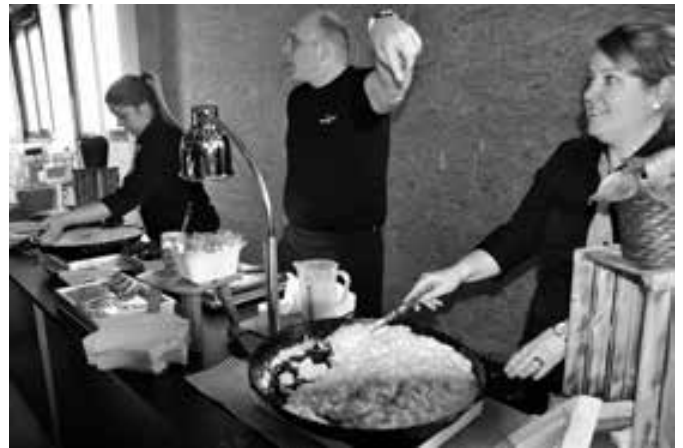
Es hat genug für Alle.

Einwohnerinnen und Einwohner. Bald werden es 10 Mio. sein. Darum ist die neue Logistikplattform nicht nur die grösste der Schweiz sondern zählt auch zu den 10 grössten in Europa. Die Anlage hat täglich bis zu 29'000 Paletten zu bewältigen. Für die Anlieferung ist auch ein direkter Bahnanschluss vorhanden. Für die Feinverteilung in die Filialen ist der LKW jedoch unersetzlich. Die rund 1'000 LKW Fahrten täglich erfordern eine exakte Planung, um selbergemachte Staus zu vermeiden. Dazu ist die Informatik ein alternativloses Hilfsmittel; rund 20 Mio. CHF der in insgesamt 300 Mio. CHF wurden allein in Software investiert. Damit können Anlieferung, Lagerhaltung, Bestellungen, Kommissionierung und Transport effizient und energieschonend gesteuert werden. Schon bei der Planung der Logistikplattform war die IT-Unterstützung ein zentrales Hilfsmittel. Mit Simulationen konnten so