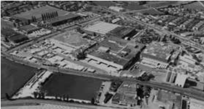
Die Luftaufnahme zeigt die direkte Einbettung in die vorhandene Verkehrsinfrastruktur.