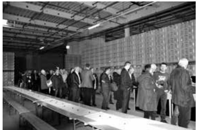
Die Schlange vor dem Buffet zeigt auch die Raumhöhe..

Konflikte schon frühzeitig erkannt und bereinigt werden. Damit war dann auf der Baustelle ein praktisch reibungsloser Betrieb möglich. Und das kam auch den Menschen zugute: bis jetzt gab es keinen mittleren oder schweren Unfall und noch nie einen Betriebsunterbruch von über 30 Minuten in 8 Jahren Planungs- und Bauzeit.